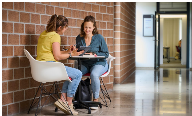
Careum initiiert und unterstützt Entwicklungen für eine bessere Gesundheitswelt.

CareX ist eine Initiative von Careum, aus der neuartige, zukunftsgerichtete Projekte entstehen. Wir nehmen den gesellschaftlichen und wirtschaftlichen Wandel als Chance wahr, um gemeinsam mit Partnern die Gesundheitswelt von morgen zu gestalten. CareX versteht sich als Werkstatt, in der konkrete Lösungen entwickelt und neuartige Spielräume kreiert werden.