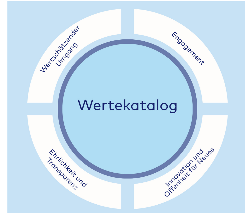
Wertekatalog der Careum Hochschule Gesundheit