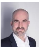
René Weber Rektor Kalaidos Fachhochschule

Welche Schritte Sie für eine Aufnahme durchlaufen müssen, erfahren Sie auf den folgenden Seiten. Nutzen Sie Ihre Chance, Teil eines Netzwerks von über 9'000 erfolgreichen Absolvierenden zu werden und bald auch Ihr EMBA-Diplom in den Händen zu halten!