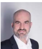
René Weber Rektor Kalaidos Fachhochschule

Welche Schritte Sie für eine Aufnahme durchlaufen müssen, erfahren Sie auf den folgenden Seiten. Nutzen Sie Ihre Chance, Teil eines Netzwerks von über 9'800 erfolgreichen Absolvierenden zu werden und bald auch Ihr EMBA-Diplom in den Händen zu halten!