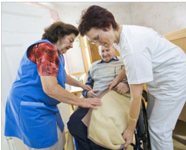
Care-Migrantinnen teilen sich die Arbeit mit der Spitex ... [1]