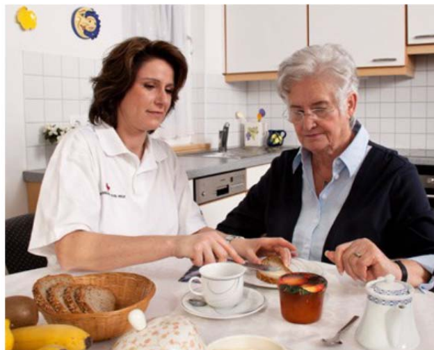
... und bieten Unterstützung im Privathaushalt. [2]

In Westeuropa und auch in der Schweiz zeigt sich seit einigen Jahren ein Phänomen, das inzwischen als «Pendelmigration» bezeichnet wird. Dieses Label umschreibt ein häusliches Versorgungsarrangement, bei dem Tätigkeiten an Care-Migrantinnen delegiert werden. Diese Migrantinnen, vornehmlich aus Osteuropa, arbeiten während mehreren Monaten in Schweizer Haushalten mit Pflegebedürftigen und kehren danach in ihre Herkunftsländer zurück, um den Dienst mit anderen Migrantinnen abzutauschen. Im Rahmen einer Projektkooperation mit der Fachstelle für Gleichstellung der Stadt Zürich werden diese Arrangements aus der Perspektive der Spitex Zürich beleuchtet. Fragen des Versorgungsbedarfs und der Versorgungsqualität werden ebenso bearbeitet wie jene der Ausgestaltung der Zusammenarbeit zwischen den ambulanten Pflegeprofis und den Migrantinnen.